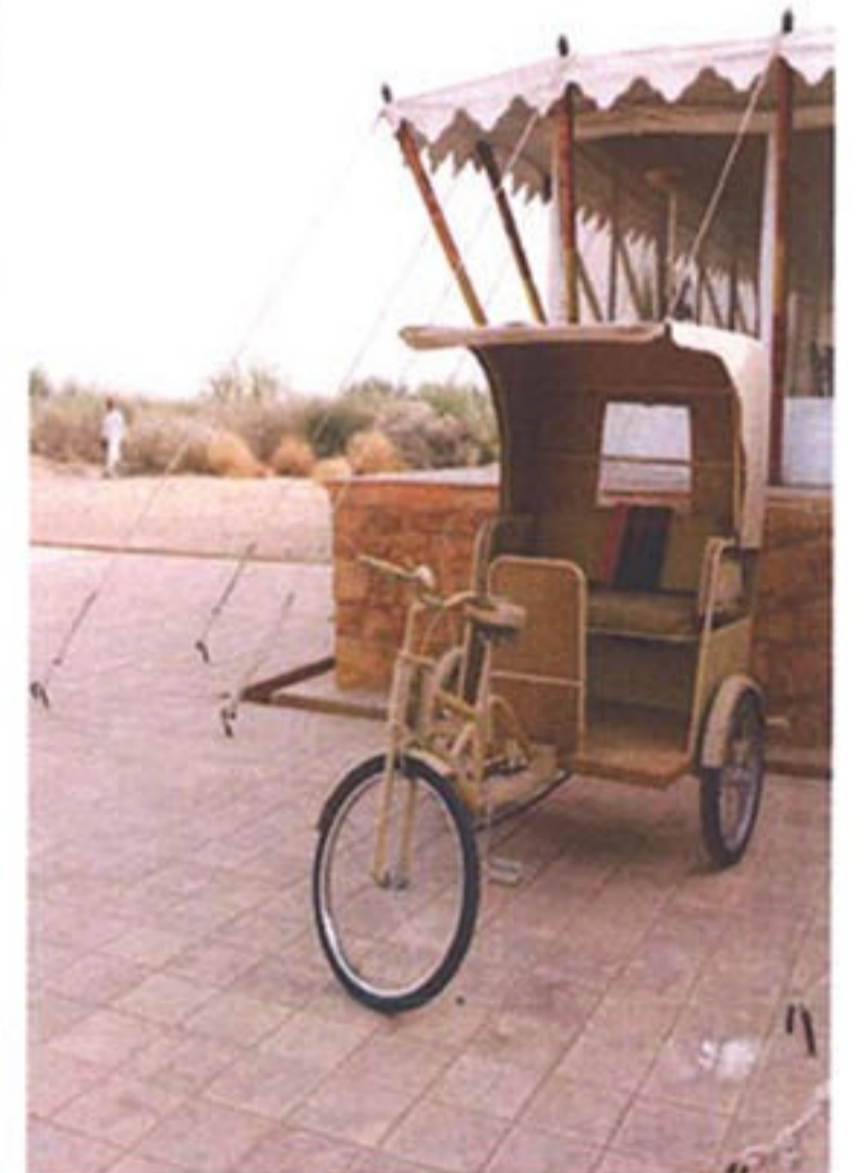
Podrás experimentar la vida india con comodidad.

AQUÍ PODRÁS VIVIR EL DESIERTO DE THAR LUJOSA Y COMODAMENTE.