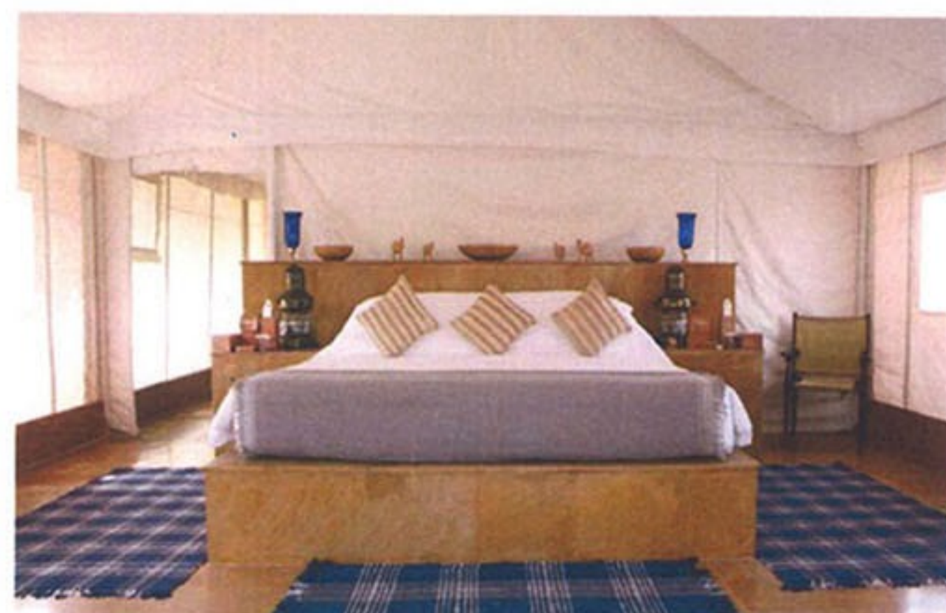
Al dormir en sus amplias tiendas olvidarás que se trata de un campamento en medio de la naturaleza.

The Serai es un concepto único, donde el contacto con la naturaleza no se encuentra peleado con la comodidad, aquí el respeto al medio ambiente y a los lugareños es parte de su filosofía. The Serai ofrece la oportunidad de disfrutar la hospitalidad rajastaní y vivir una experiencia de safari en la vastedad del desierto de Thar sin sacrificar el confort de un hotel cinco estrellas.