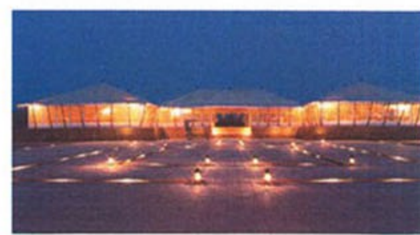
El silencio de la naturaleza es, aquí, tu mejor compañero.

de abril, debido a que después de esa época el desierto de Thar se encuentra azotado por poderosas tormentas de arena, y en la época del monzón los ríos vecinos se desbordan impidiendo el acceso. Las tiendas de campaña están ancladas a una base de cantera y abarcan un área de 300 metros cuadrados. Por dentro son tan espaciosas que incluso tienen tres ambientes separados: el recibidor, donde se encuentra un escritorio de madera color canela decorado con quinqués de cobre; el dormitorio, con cama king size, espejo de cuerpo completo,